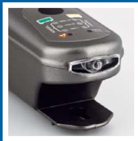
Praktické světlo na přední straně ulehčuje práci za tmy.

Nabíječky EXIDE zajistí optimální nabití baterií od 1 Ah až do 300 Ah. Mají integrované světlo pro použití za tmy, speciálně navržené svorky pro optimální nabíjení a kabel, který se elegantně vine kolem nabíječky, pro snadné použití. Naše nabíječky mají všechny vlastnosti, o kterých víme, že je naši zákazníci hledají. Rozumíme bateriím. Teď je tady nabíječka, která to dokáže využít.