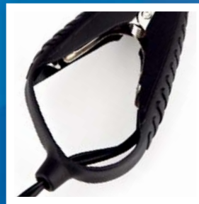
Speciálně navržené svorky udržují vodiče na místě a ulehčují manipulaci.