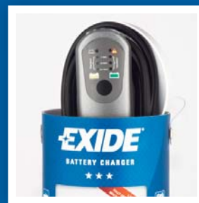
Praktický obal pro bezpečné uložení.