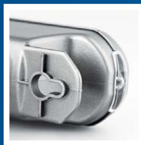
Může být zavěšená, nebo připevněná na stěnu.