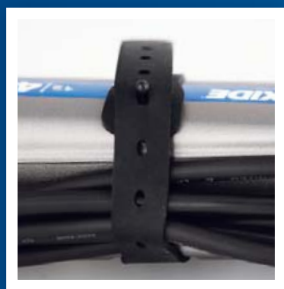
Snadná manipulace s kabely s fixačním popruhem.